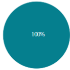
การแสดงความคิดเห็นแบ่งตามเพศ

ทั้งหมด 918 คน แสดงความคิดเห็น 918 คน ไม่แสดงความคิดเห็น 0 คน